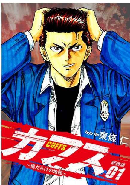
『CUFFS 傷だらけの地図』 32巻